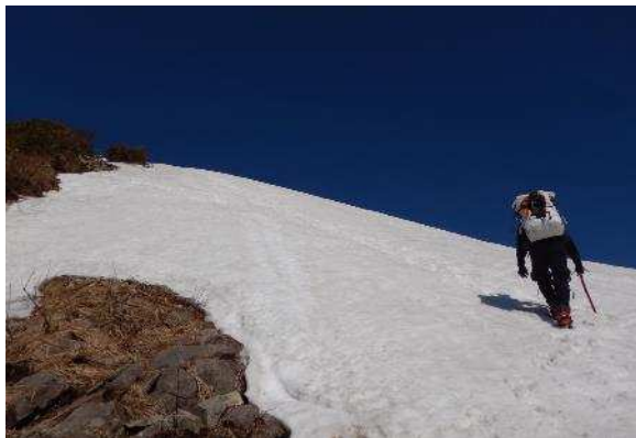
青空と雪面のコントラスト