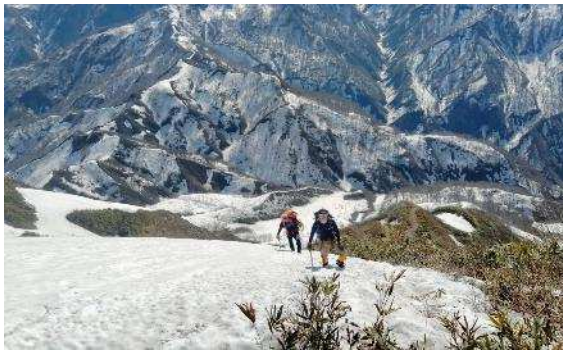
荒菅沢からの登り返し

今シーズン最後の雪山を、簡単には行けない遠方の雨飾山で締め括ることができました。また個人的には久しぶりの初登頂百名山で、46/100 座になりました。 by H